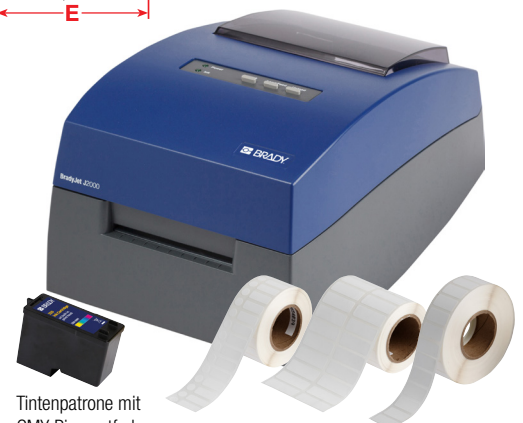
Tintenpatrone mit CMY-Pigmentfarbe für den J2000 Drucker